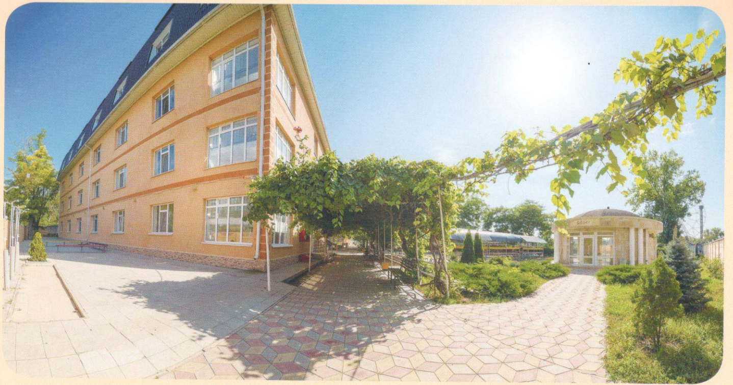
“Санаторий Янтарь” спальный корпус №2