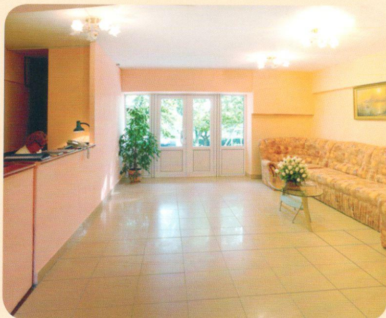
Спальный корпус №1 (ресепшен)

«Санаторий Янтарь» расположен в уникальном живописном уголке курортной зоны города-курорта Анапа на берегу реки Анапка, впадающей в Черное море. Это перспективная и динамично развивающаяся круглогодичная здравница, которая предлагает прекрасные возможности для совмещения оздоровления и отдыха детей со всех уголков России. На территории санатория находится детская площадка с уличными тренажерами, столы для настольного тенниса, спортивные площадки (волейбольная, баскетбольная, для большого тенниса) и футбольное поле. Также имеется детское кафе. Разнообразные тематические мероприятия ребята могут посетить в клубе детского творчества, там же с огромным удовольствием отдыхающие демонстрируют свои вокальные данные с помощью «Караоке». Придают красоту и уют ухоженные цветущие клумбы роз, которые расположены вдоль прогулочных дорожек. Вся территория санатория огорожена по всему периметру, круглосуточно охраняется и оснащена камерами видеонаблюдения. Ежегодно с детьми работает педагогический отряд, аниматоры, квалифицированные педагоги, психологи, воспитатели. Интересно и содержательно организован досуг: проводятся веселые конкурсы, концерты, культурно-развлекательные мероприятия, квесты, дискотеки, шоу-программы, соревнования. Ежедневно на «Янтарь-арене» ребята раскрывают и совершенствуют свои таланты, за что получают поощрительные призы.