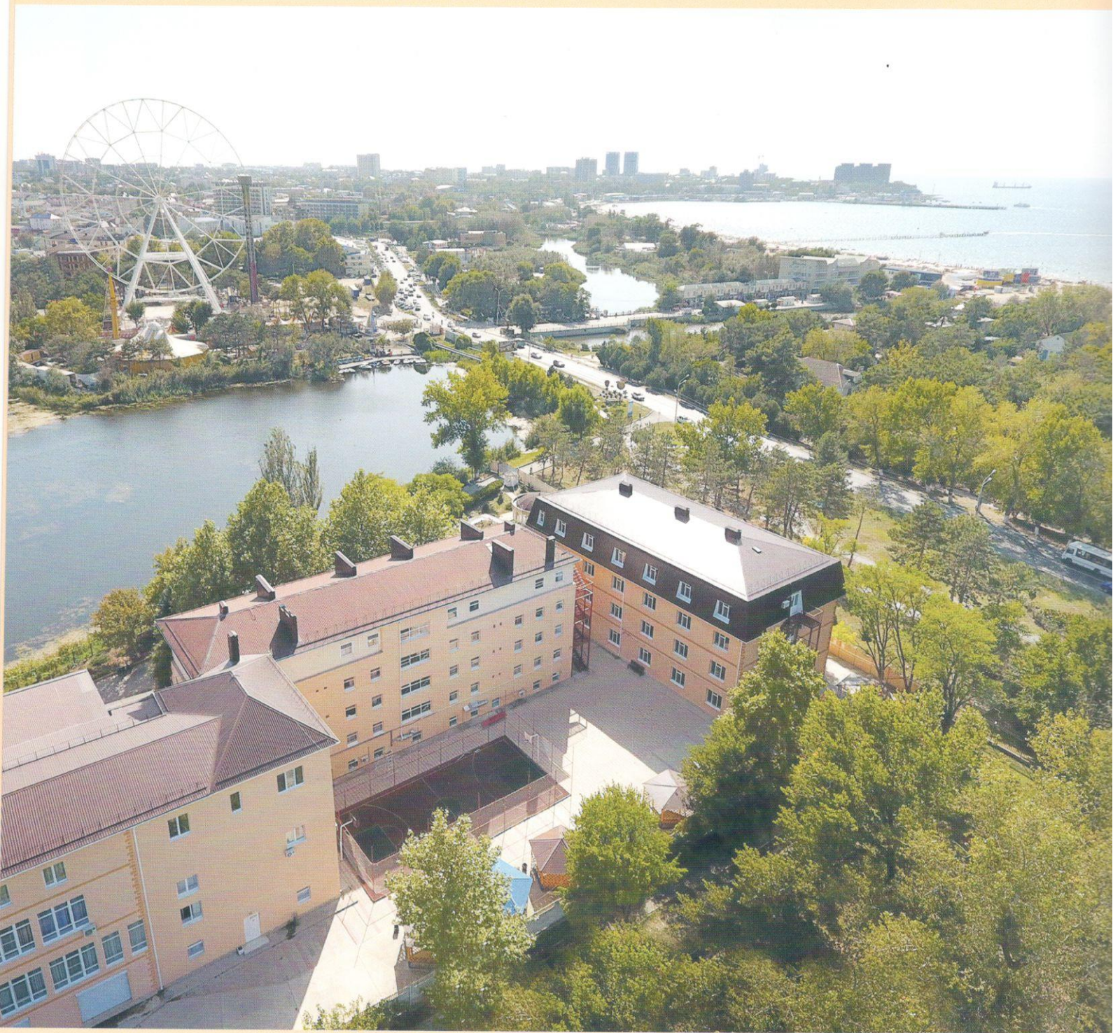
“Санаторий Янтарь” вид сверху