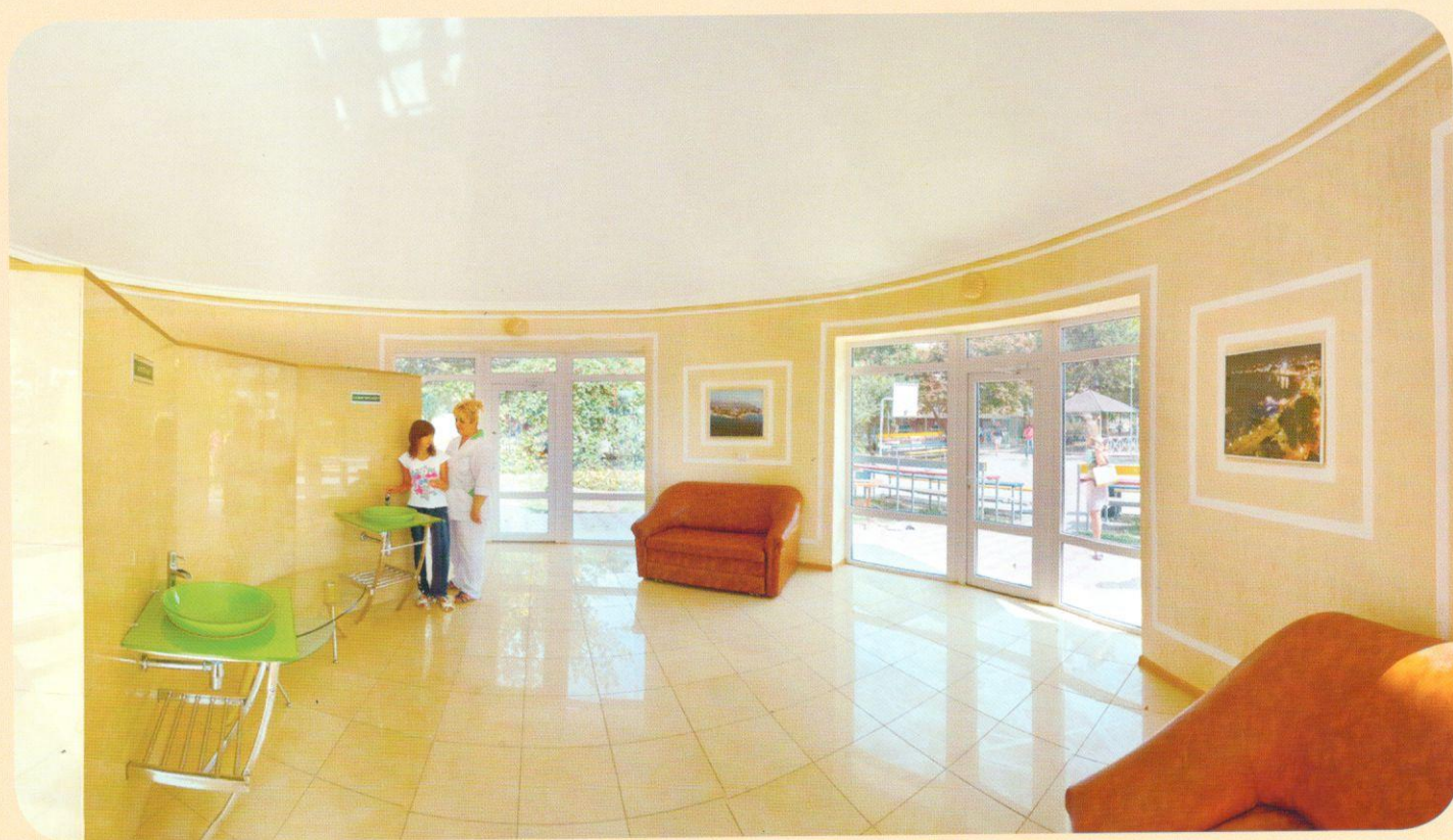
Питьевой бювет "Янтарный"