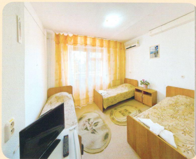
3-х местный номер