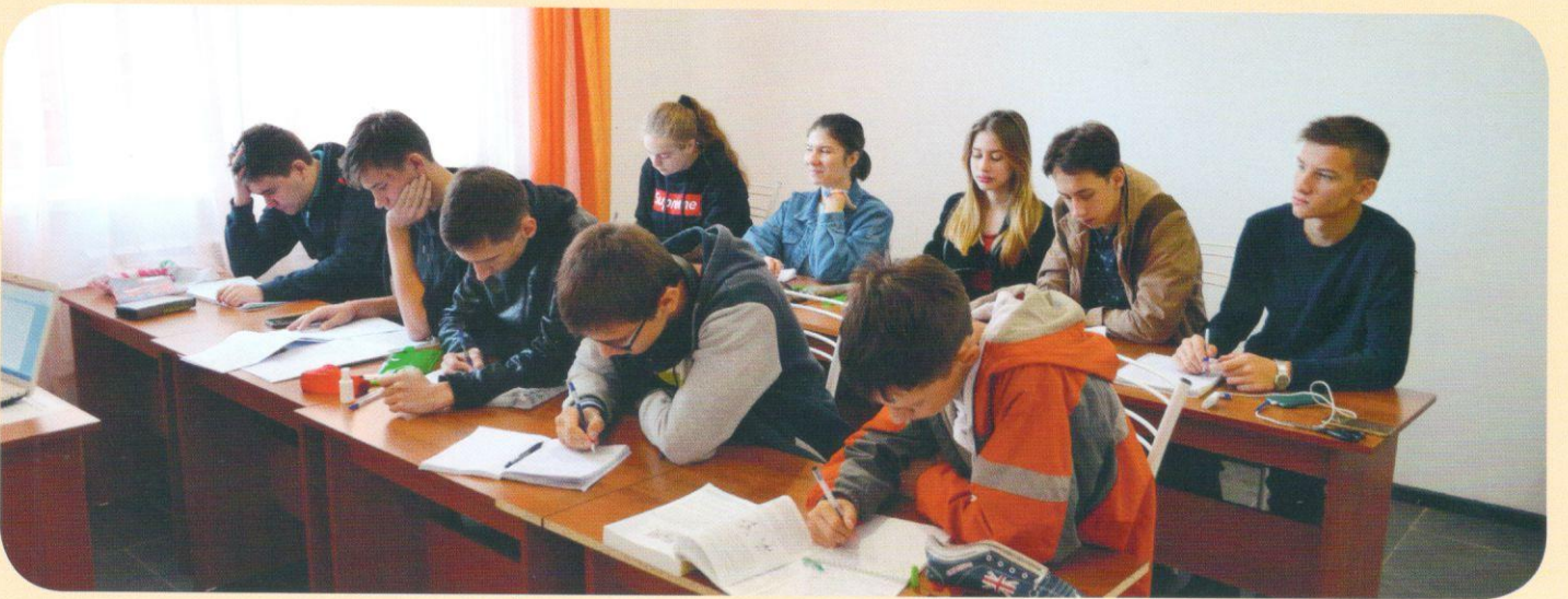
Кабинеты дополнительного образования