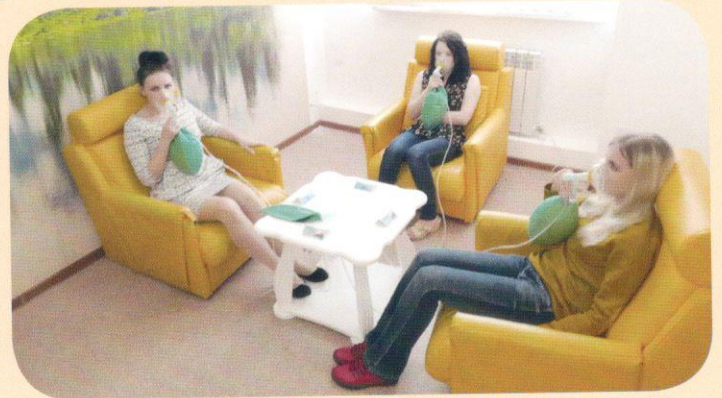
Гипокситерапия "Горный воздух"